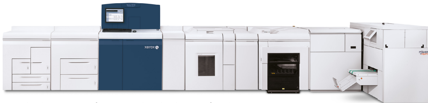
Sistema di produzione Xerox Nuvera® 157 EA con Impilatore di produzione Xerox® e Watkiss PowerSquare 224