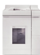
Modulo di finitura base