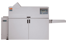
Stazione di creazione libretti C.P. Bourg BDFNx