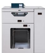
Alimentatore C.P. Bourg BSFx Dual-Mode