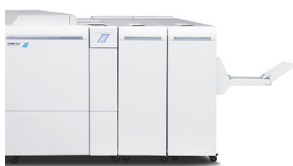
Stazione di finitura libretto Plockmatic Pro 50/35 (disponibile solo sui modelli 120/144/157)