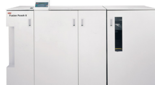
GBC® FusionPunch® II con impilatore offset