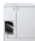
Xerox® Tape Binder