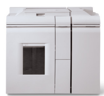
Modulo di finitura base-Direct Connect