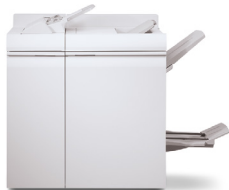
Stazione di finitura multifunzione Pro Plus