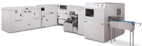
Xerox® Book Factory