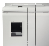
Modulo di finitura base Plus