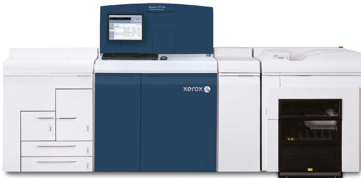
Sistema di produzione Xerox Nuvera® 157 EA con impilatore di produzione Xerox®